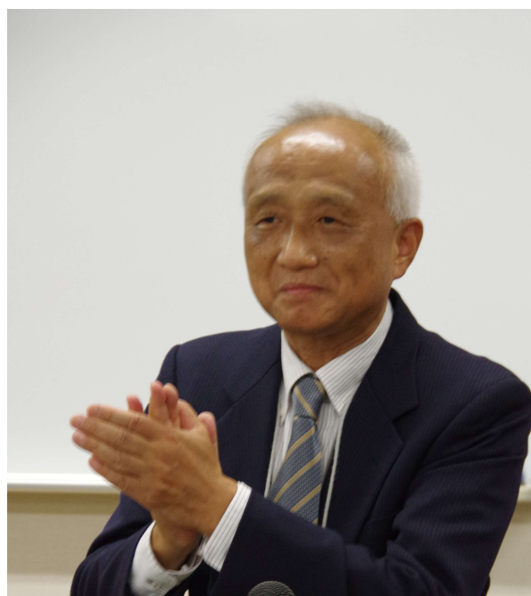
中締め〔地質リスク学会 小笠原副会長〕