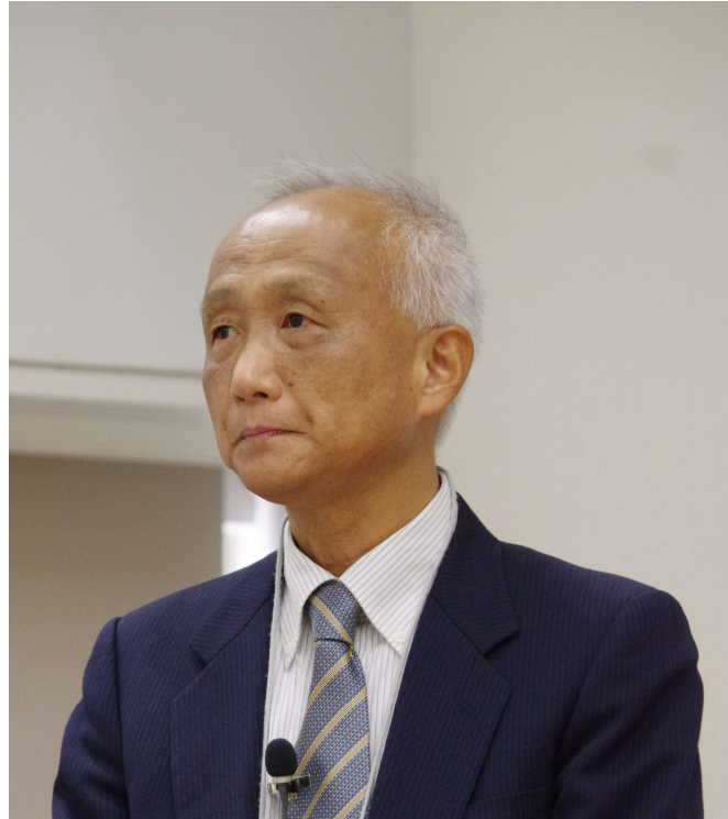
開会挨拶〔地質リスク学会 小笠原副会長〕