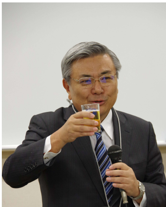
乾杯〔全地連 成田会長〕